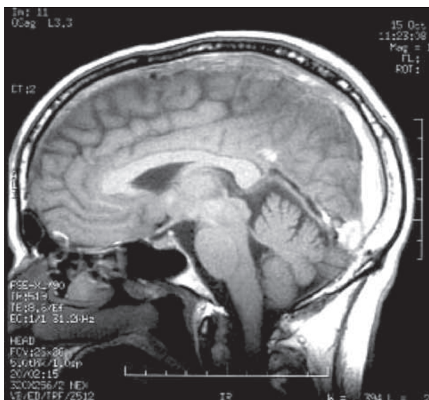
Figura 1. RM. Plano sagital. Aumento de densidad a nivel del seno longitudinal superior y, parcialmente del seno recto.